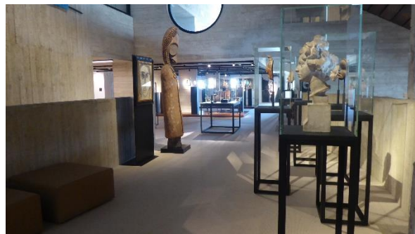
Delvaux : 6 de verdieping