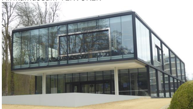
TEMBO Restaurant met uitzicht op het museum