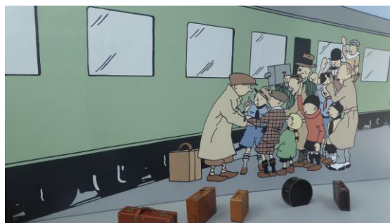
Hergé museum (2009) in LLN