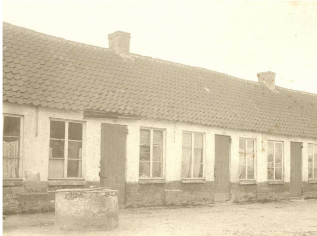
Rij werkmanshuisjes in Sint-Niklaas