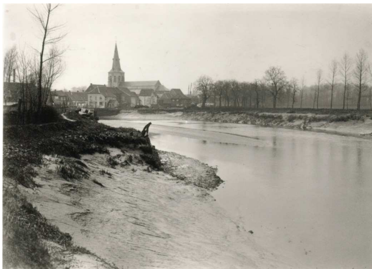
De Durme in Waasmunster vóór de rechtekking, 1930